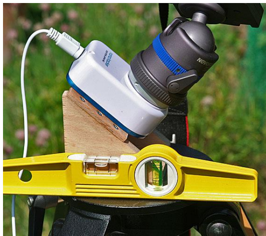
Bild 5 Ausrichten des Stativs mit Hilfe einer Wasserwaage

Für meine Versuche habe ich ein kompaktes, aber stabiles Berlebach-Stativ verwendet, das auch als Reisestativ in einen normalen Koffer unterzubringen ist. Einen Getriebekopf besitze ich leider nicht. Um für den Versuch bezüglich Stabilität keine Kompromisse einzugehen, habe ich mir aus Buchenmultiplexplatten einen feststehenden Polhöhenkopf angefertigt, der genau auf meine Polhöhe von zuhause konstruiert ist. So brauche ich nur das Stativ mit einer Wasserwaage genau zu nivellieren, und die Polhöhe stimmt. Das empfand ich als große Erleichterung, wenn man sich nur noch um den Azimut kümmern muss.