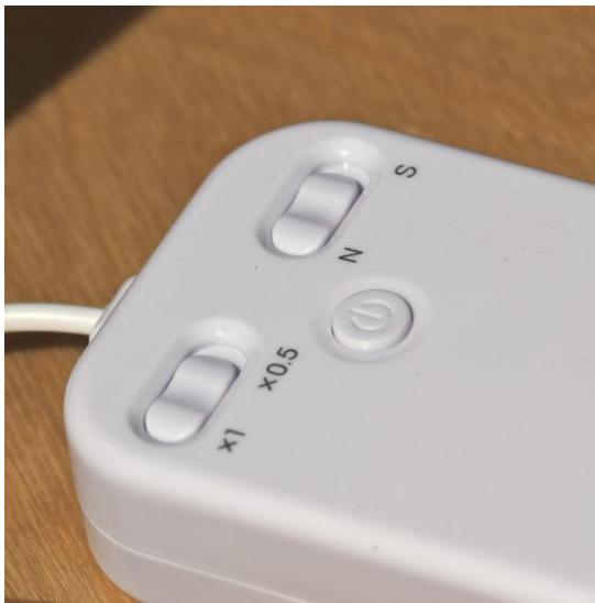
Bild 3 Bedienelemente am Bedienteil

Die Drucktaste ist der Ein- / Ausschalter. Die weißen Bedienelemente am weißen Gehäuse sind allerdings nicht gut erkennbar.