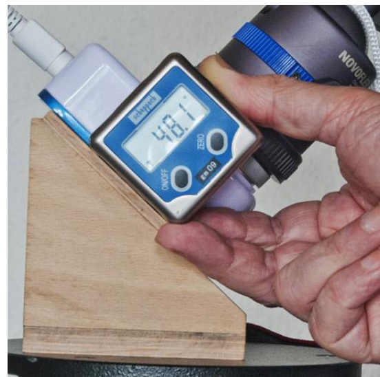
Bild 4 Kontrolle der Polhöhe mit einer digitalen Neigungswasserwaage