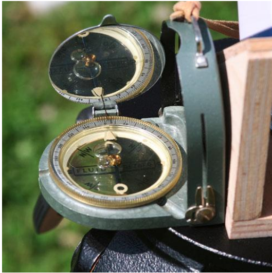
Bild 6 Nordausrichtung des Nano Trackers mit Hilfe eines Kompasses.

Für die genaue Ausrichtung des Nano Trackers besitzt das Motorteil eine Visierbohrung, durch die der Polarstein angepeilt werden muß. Dieses Vorgehen erfordert jedoch einige Übung, zumal wenn das Stativ, der Stabilität wegen, oft nicht sehr hoch ausgezogen wird. Dann ist die Körperhaltung, um durch die Bohrung blicken zu können, schon recht unbequem. Da hat es sich als positiv erwiesen, daß ich bei meinem selbstgebauten „Polhöhenblock“ mich nur noch um den Azimut kümmern mußte.