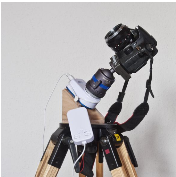
Bild 1 Der Nano Tracker auf einem Berlebach-Stativ. Die Kamera ist eine Canon EOS 60Da mit 50mm - Objektiv

Der Nano Tracker besteht aus zwei Teilen, weiße Kunststoffgehäuse. Das eine ist die Antriebseinheit, das andere die Bedieneinheit und Batteriegehäuse. Die weiße Farbe empfand ich beim Hantieren im Dunkeln als sehr nützlich. Allerdings sind die weißen Bedienelemente auf dem weißen Gehäuse bei schlechtem Licht nicht gut zu erkennen.. Es liegt ein Faltblatt mit englischsprachiger Bedienungsanleitung bei. Die Funktion und Bedienung ist eigentlich selbsterklärend, so dass der Umfang der Beschreibung m.E. völlig ausreicht, auch wenn es einige Ungereimtheiten gibt.